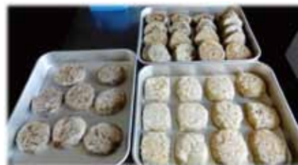
炭火焼〇△□ほっぺたやき