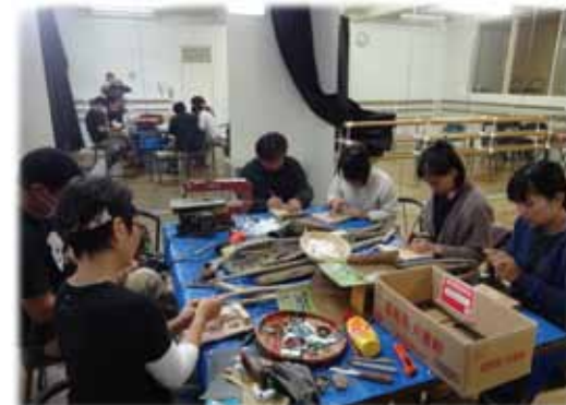
アートワークショップの様子

【温泉が近い！】 小金湯温泉→車で約10分 定山溪温泉→車で約20分 豊平峡温泉→車で約30分