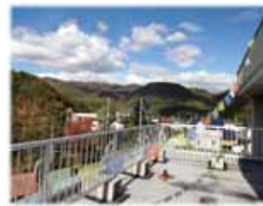
山々の景色が見渡せます。