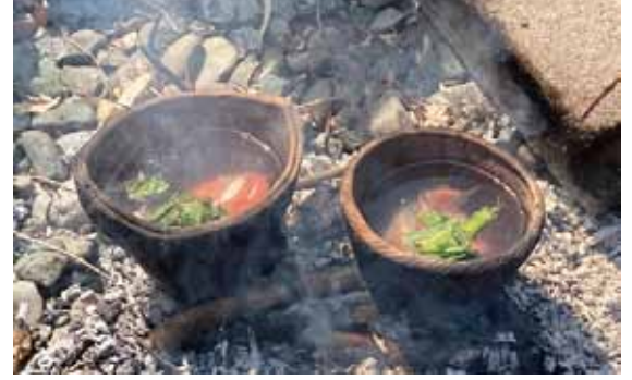
●ミニ土器をつくろう！ワークショップ（2018年、2019年、2022年）