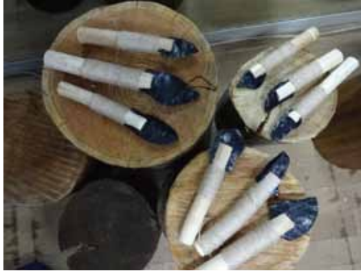
●黒曜石のナイフをつくろう！ワークショップ（2021年）