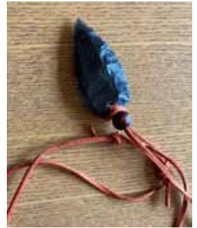
●黒曜石で矢じりのペンダントをつくろう！ワークショップ（2024年）