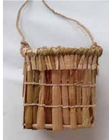
●縄文ポシェットをつくろう！ワークショップ（2023年）