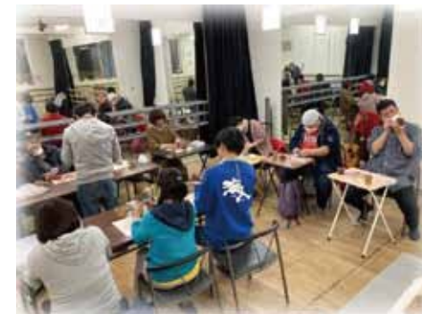
アートワークショップの様子