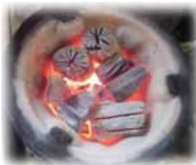
炭火焼○△□ほっぺたやき